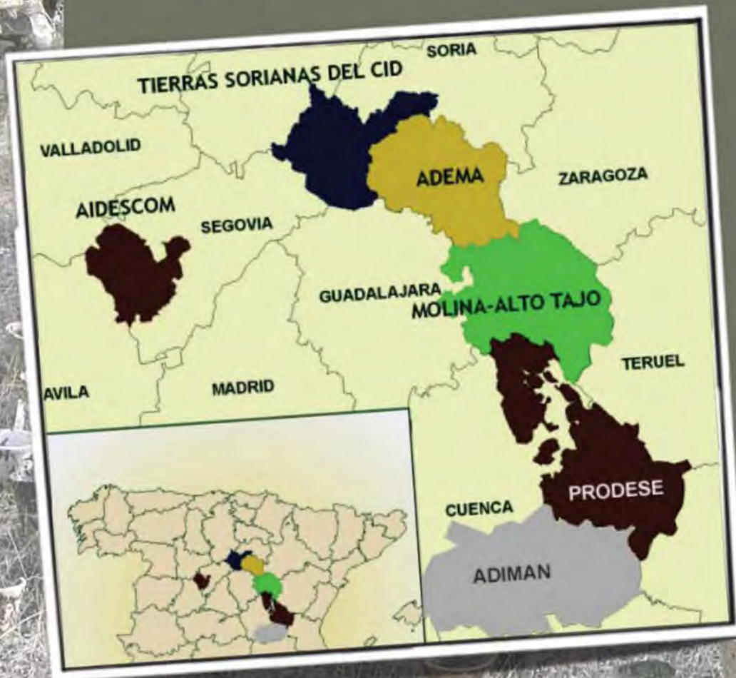
Mapa del territorio (a corazón abierto)