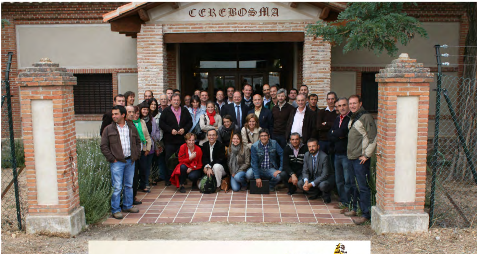
II Simposio Internacional de Resinas Naturales Remasa RESINADROMASA SUST FOREST